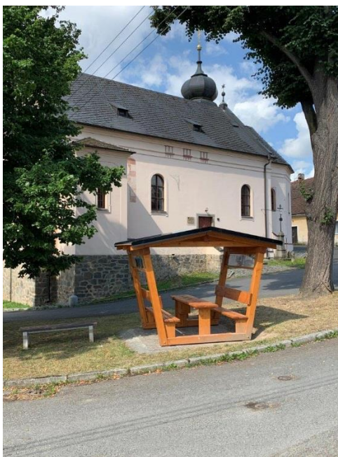
Jeden z deseti infopointů na území MAS Pošumaví v Běšinech

V rámci tohoto projektu se uskutečnily 4 semináře nejen v Klatovech, ale i u partnerských MAS, se zaměřením na regionální cestovní ruch. Dále byla vytištěna brožurka, kde jsou shrnuty vybrané turistické cíle v Pošumaví v návaznosti na databázi infopointů.