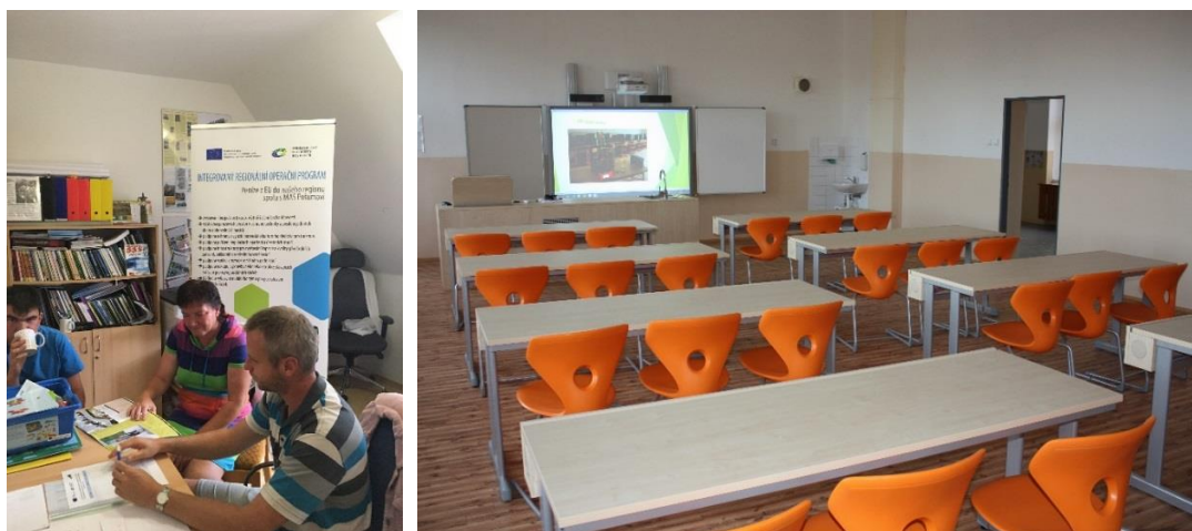
Seminář pro žadatele do oblasti sociálního podnikání a ZŠ Komenského Horažďovice - učebna

V rámci výzev vyhlášených nebo hodnocených v roce 2019 bylo podpořeno 10 projektů a rozdělena částka 21 374 525,12 Kč . Do výzev č. 15. Sociální podniky a 18. Rozvoj sociálních služeb se nepřihlásil žádný žadatel.