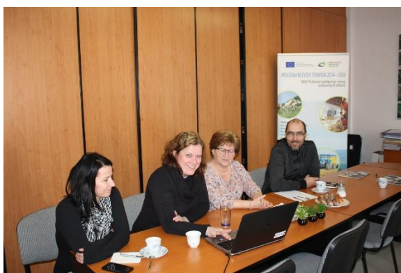
Semináře k vyhlášené výzvě PRV v Chanovicích a Hartmanicích