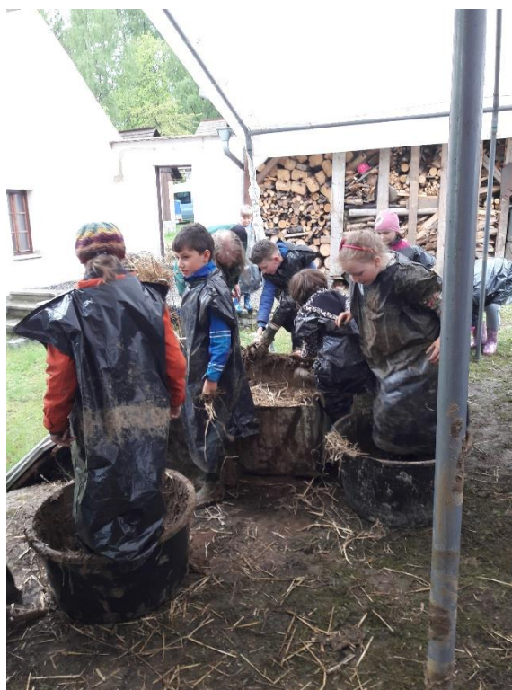
Děti si vyzkoušely výrobu cihel z nepálené hlíny ve Skanzenu v Chanovicích

Podrobnější informace o většině akcí jsou uveřejňovány v průběhu roku na webu www.masposumavi.cz pod záložkou horní lišty – „MAP a animace škol a šk. zařízení“ v 1. oddíle: „MAP II - místní akční plán rozvoje vzdělávání dětí a žáků do 15 let“. Zde je uveřejněn seznam členů ŘV a seznamy členů jednotlivých pracovních skupin včetně zápisů z jejich jednání.