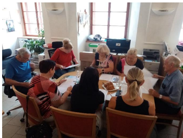
Jednání Výběrové komise MAS Pošumaví, z.s. dne 1.8.2022

Celkem bylo přijato 43 žádostí o dotaci, v rámci administrativní kontroly a věcného hodnocení byla jedna vyřazena.