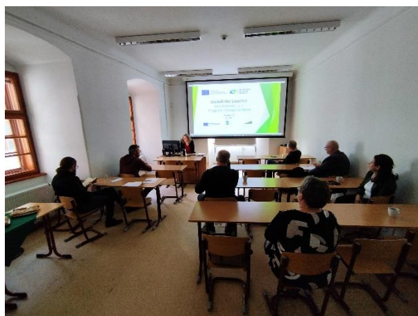
Seminář pro žadatele dne 22.2.2023

Dále proběhly přípravy zpracování tzv. programových rámců, podle nichž budou vyhlášovány výzvy k podání žádostí o dotace v novém programovém období pro roky 2023-2027, přičemž v tomto období je program nově pojmenován jako „Společná zemědělská politika“.