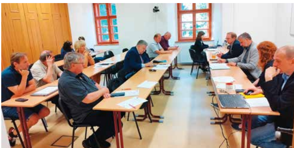
Jednání výkonné rady v roce 2025.