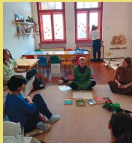
Ze semináře „Potřebuji..., pomoz mi s tím.“

Děti na „Kroužku zvědavých žáků“ při provádění pokusů.