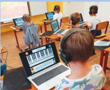
Získané notebooky při výuce.

Mezi další oblíbené aktivity žáků patří práce s tablety a QR kódy, procvičování angličtiny a dalších předmětů. Zábavnou a přitažlivou formou můžeme díky novému vybavení posílit účinnost naplňování primární prevence v oblasti kyberšikany, bezpečného pohybu v on-line prostředí atd. S novými robotickými pomůckami žáci pracují nejen v nově vzniklé vzdělávací oblasti Informatika, ale i v rámci kroužku.