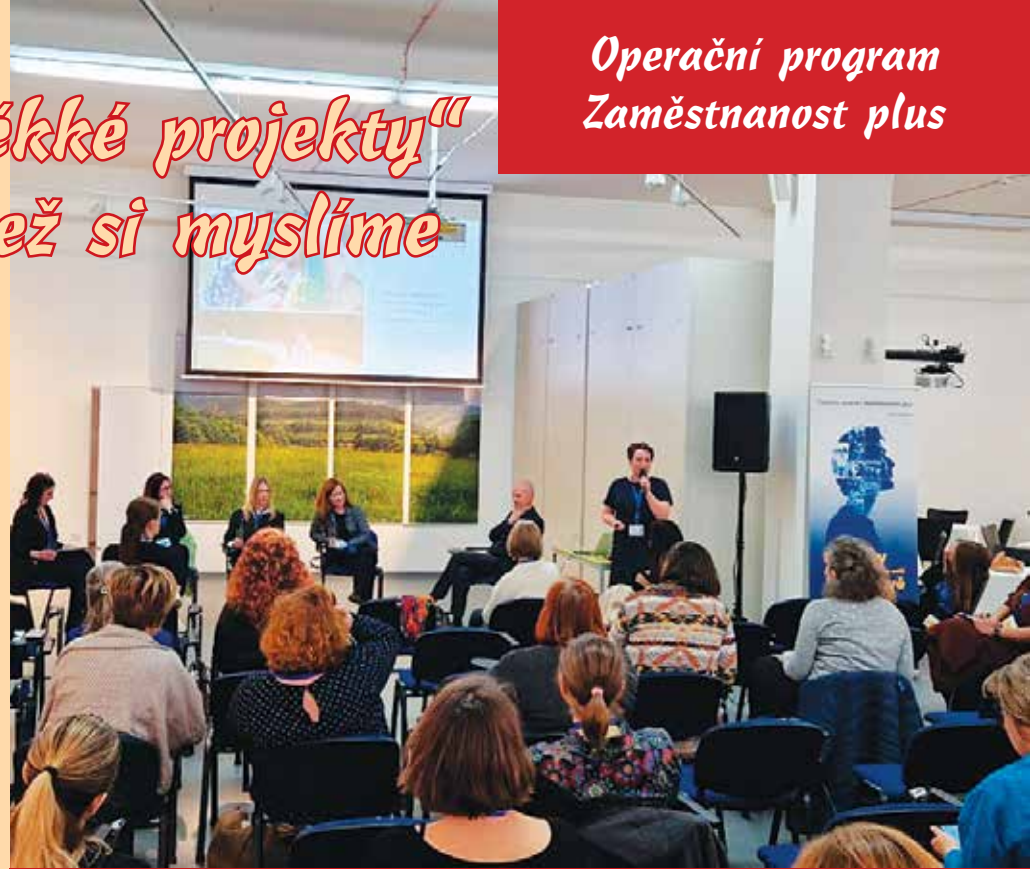
Prezentace projektu MAS Pošumaví na konferenci ministerstva práce a sociálních věcí.

Jednou z hlavních myšlenek konference bylo, že venkov čelí zásadním změnám – stárnutí obyvatel, nedostatku služeb a odlivu mladých. A právě proto jsou tzv. měkké projekty klíčové, nejde v nich o stavby a betony, ale o práci s lidmi, o posilování komunit, které si pomáhají navzájem.