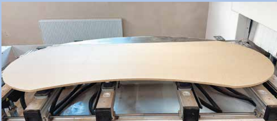
Opracování materiálu do různých tvarů je nyní v truhlárně výrazně snadnější úkol.