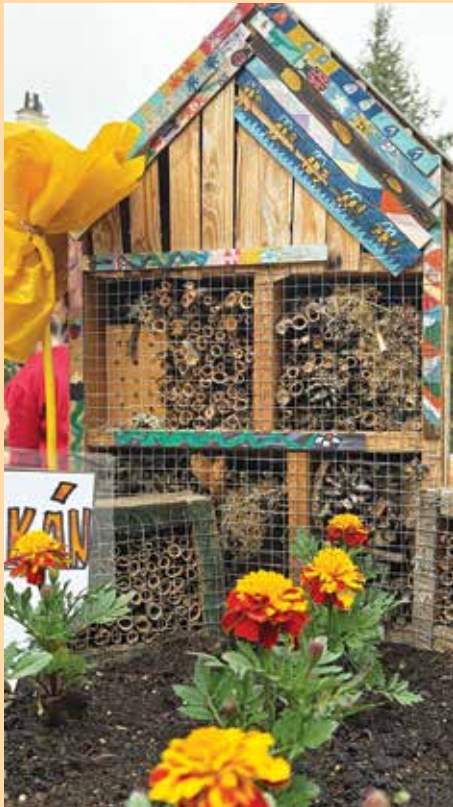
Hmyzí domeček v záhonech zahrady.

Součástí programu byla prohlídka zahrady, ukázka komunitního pěstování a diskuse o budoucích aktivitách. O příjemnou atmosféru se postaral kytarový kroužek DDM Klatovy se svým vystoupením. Otevření zahrady se zúčastnili zástupci města, médií, místních organizací, obyvatelé, kteří se na projektu podíleli i široká veřejnost. Odhadujeme, že za celý den se na malém pozemku vystříдалo přibližně 100 návštěvníků.