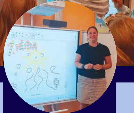
Nové vybavení nabízí jiné možnosti výuky.

Výuka v novém žáky nesmírně baví a užívají si ji každým dnem. Na podnět ro-