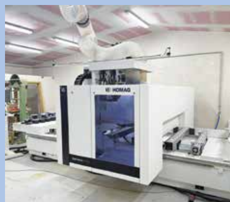
CNC fréza v truhlářství v Dolanech (OP TAK).

MAS Pošumaví ukončila příjem projektů ve výzvě č. 3 OP TAK. Alokace byla stanovena ve výši 7 765 157,95 Kč a podpora byla ve výši 50 %. Byl přijat pouze jeden projektový záměr a tím pádem alokace pro stávající období nebude vyčerpána. Na zbývající alokace v tomto opatření byla vyhlášena výzva č. 4. Termín pro příjem žádostí je do srpna 2025.