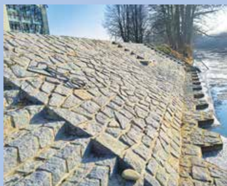
Upravené břehy řeky v Horažďovicích (IROP).