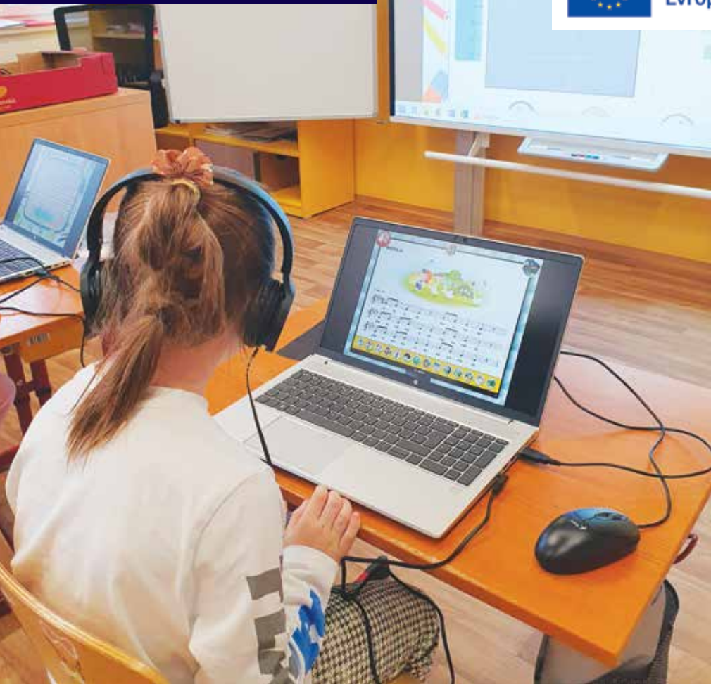
Podpora z IROPu umožnila modernizaci Základní školy v Dlouhé Vsi.