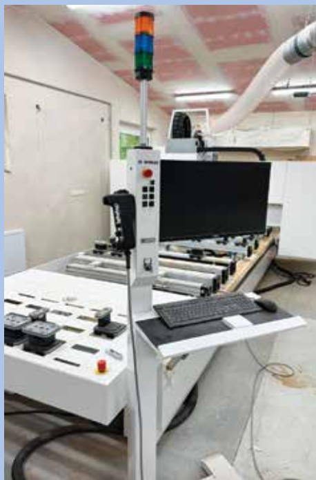
Fréza umožňuje větší automatizaci.

„Jsme stále v začátcích našeho projektu a doufáme v to, že tomu tak bude. Od pořízené technologie si slibujeme velký přínos hlavně v kvalitě zpracovaných výrobků, což je pro nás důležité. Díky projektu MAS Pošumaví jsme si mohli tuto technologii dovolit, za což jsme moc vděční.“