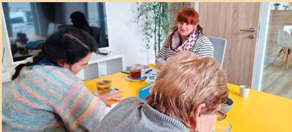
Svépomocná skupina na Kdyni.