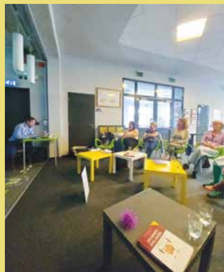
Seminář „Proč musí být pedagog na půl úvazku hypnotizér, aby mohl plnit své povolání.“