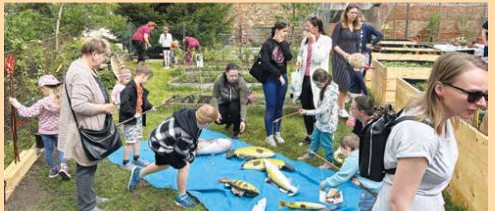
Pro děti byly na zahradě připraveny různé aktivity.