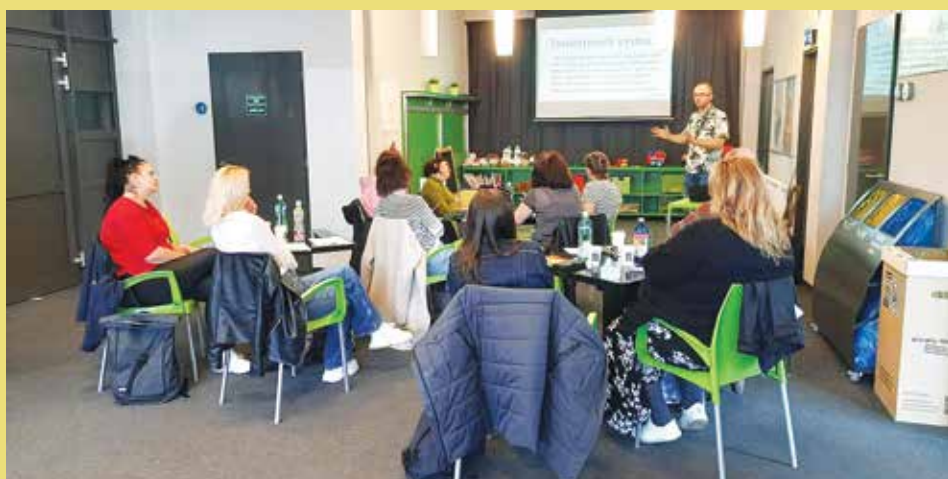
Seminář „Tandemová výuka je super“.