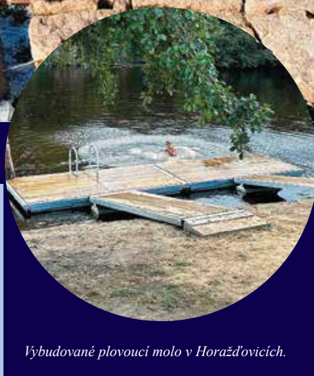
Vybudované plovoucí molo v Horažďovicích.

„Očekáváme zvýšení návštěvnosti nejen říčního úseku, ale celé lokality včetně samotného města. Toto očekávání však ještě v sezóně 2025 může být částečně ovlivněno aktuálně probíhající stavbou „Revitalizace sportovního areálu Lipky“, která se nachází bezprostředně vedle, kde je umístěn vodácký kemp a jeho zázemí. Zároveň v tomto roce probíhá úplná rekon-