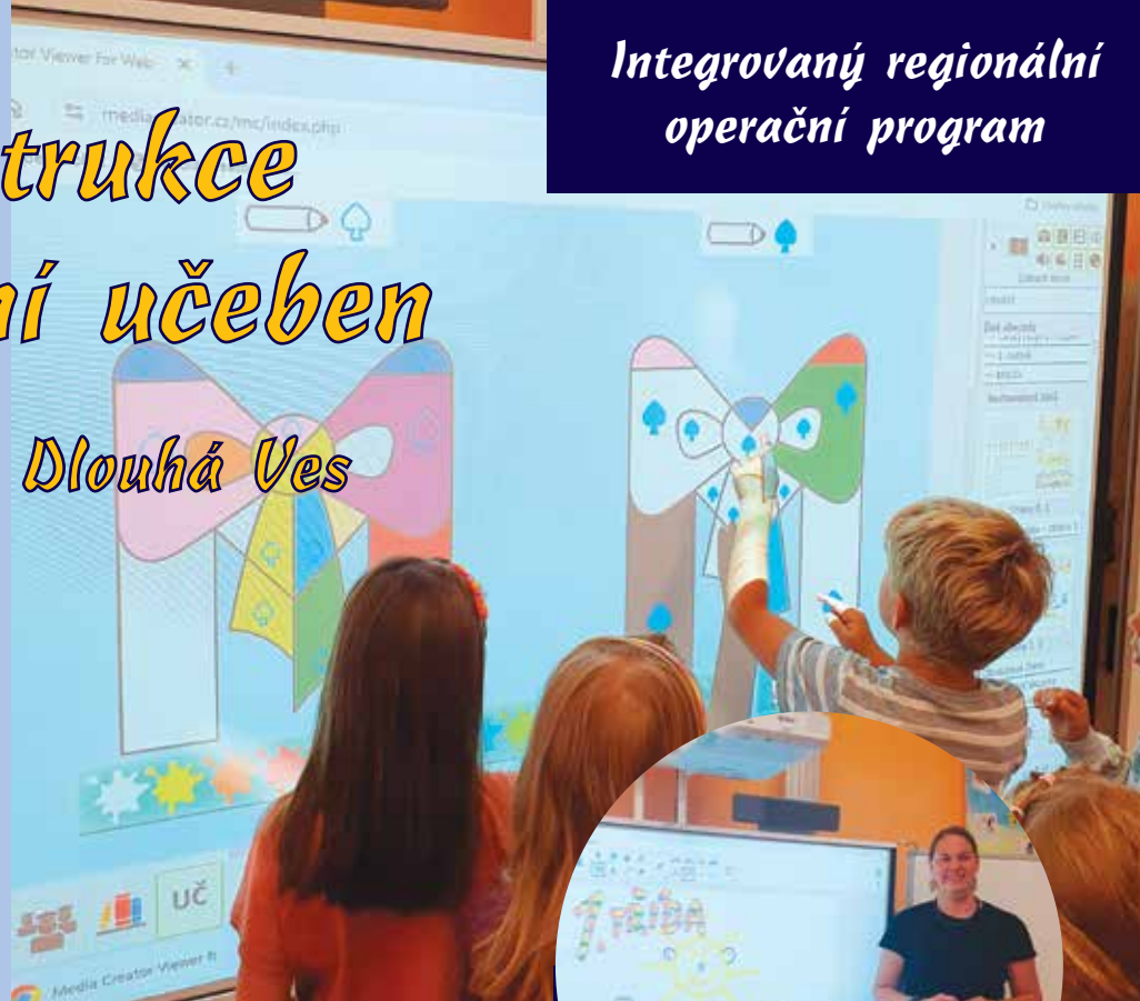
Žáci před novou interaktivní tabulí.

Velmi si chválíme možnost vytvoření kombinované učebny, která poskytuje zájemci nejen paním asistentkám v rámci podpůrných opatření, ale také umožňuje praktikovat dělenou výuku ročníků, které se jinak v našem malotřídním systému vzdělávají společně v jedné třídě. Díky tomu je zajištěn naprosto individuální přístup ke každému žákovi a jeho potřebám. Velmi si totiž zakládáme na našem „rodinném“ přístupu k výuce v menších skupinách.