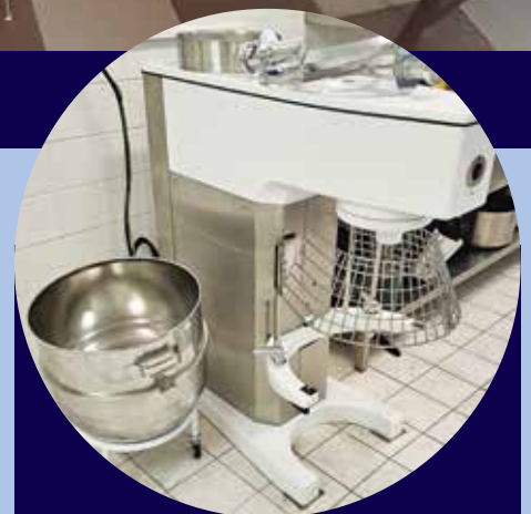
Kuchyňský robot s příslušenstvím školní jídelny v Nařovských Horách.

Celkem bylo podáno 56 žádostí o dotaci, přičemž 6 žádostí bylo v rámci Fiche 1, dále 47 žádostí v rámci Fiche 5 a 3 žádosti v rámci Fiche 6. Žádosti budou seřazeny na základě námi stanovených bodových