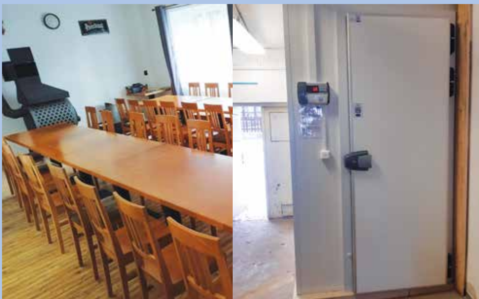
Vybavení spolkové místnosti SDH Němčice a chladicí box Mysliveckého spolku Chanovice.

kritérií, přičemž následně vzniklé bodové pořadí rozhodne o tom, které budou podpořeny.