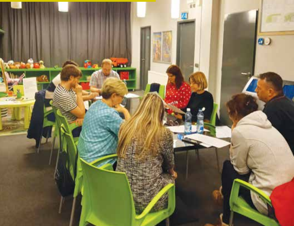
Ze setkání pracovních skupin.