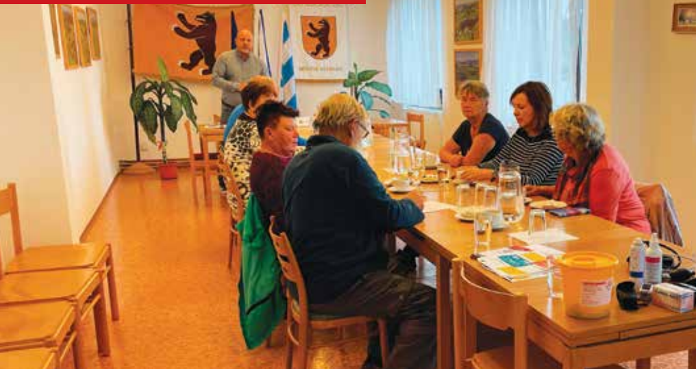
Beseda o neformální péči s pečujícími ve Všerubech.