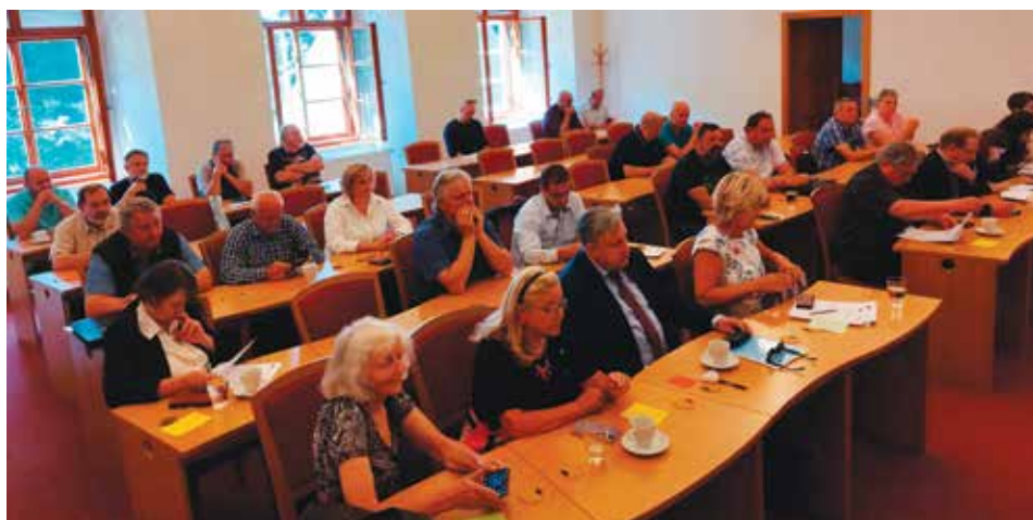
Červnová valná hromada MAS v prostorách bývalého dominikánského kláštera v Klatovech.