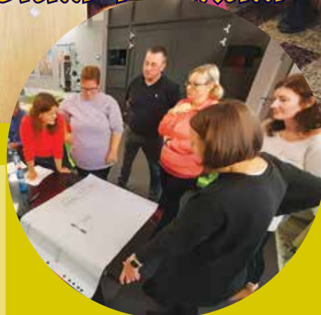
Ze setkání pracovních skupin MAP.

Kromě toho funguje také naše externí konzultační služba, na kterou se mohou obracet rodiče i učitelé stran problémů, jako je kyberšikana a problémy dětí s virtuálním světem, koučování, čtenářská gramotnost, hyperaktivita apod.