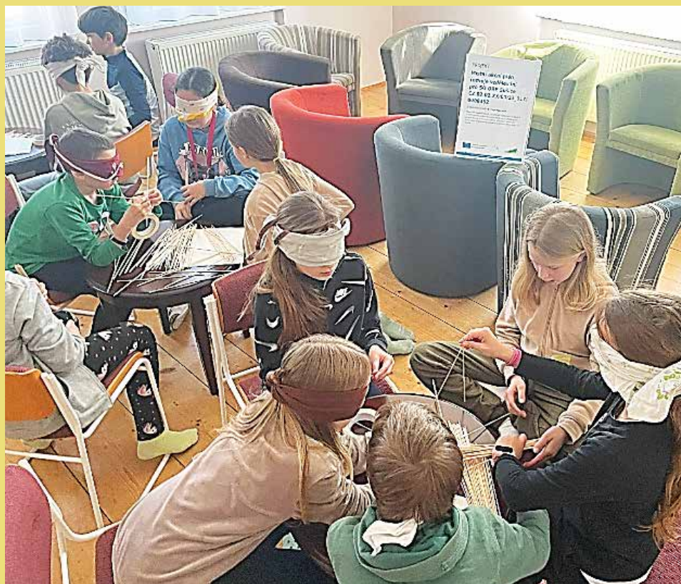
Děti ze Sušicka zapojené v zážitkovém programu „Expedice džungle – mise přežití.“