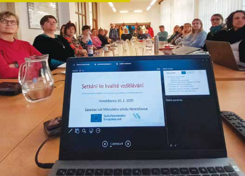
Setkání ke kvalitě vzdělávání.