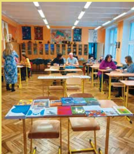
Na semináři „Podpora nadání na ZŠ“.