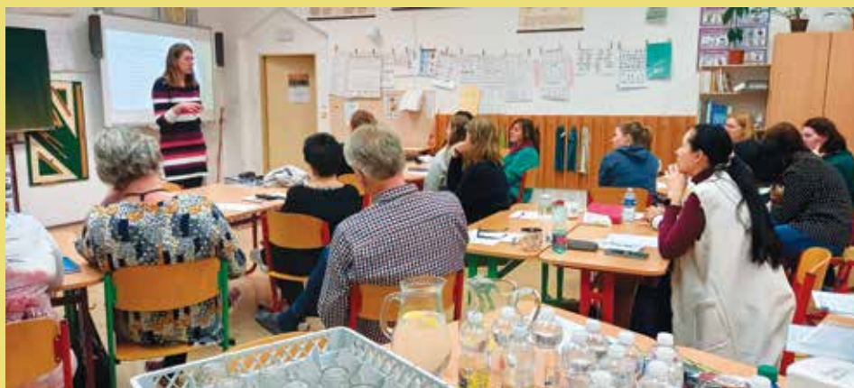
Seminář „Spolupráce učitele a asistenta“ v Nalžovských Horách.