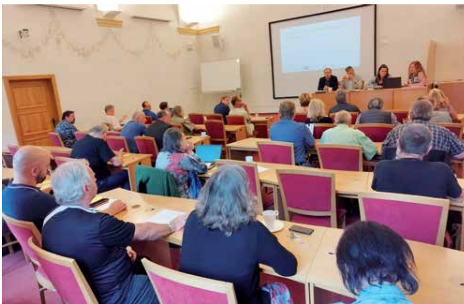
Červnová valná hromada MAS v prostorách bývalého dominikánského kláštera v Klatovech.