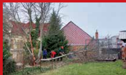
Příprava pozemku pro vytvoření komunitní zahrady – čištění od náletových dřevin.

Na základě iniciativy členů Základní organizace Českého zahrádkářského svazu Klatovy I – střed vzniká komunitní zahrada za moštárnou ve Šmilovského ulici. Ve spolupráci s MAS Pošumaví je pozemek postupně upravován a přibývají zájemci o komunitní pěstování.