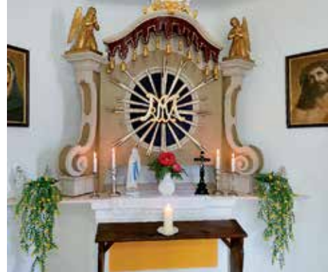
Zrekonstruovaný oltář v kapli.