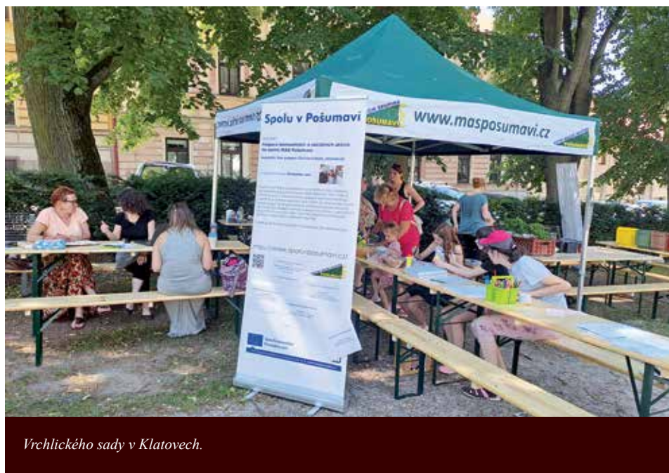
Vrchlického sady v Klatovech.