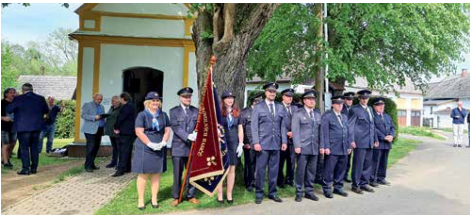
Členové místního sboru dobrovolných hasičů před kaplí.

V centru obce stojí kaple Panny Marie, která byla postavena v r. 1862, kdy Kaničky spadaly do panství Černínů z Chudenic. Architekturu průčelí připomíná sýpku v nedalekých Únějovicích. Nikdy se nejednalo o památkově chráněnou stavbu, a tak léta chátrala. V roce 2016 byla z prostředků programu PSOV Plzeňského kraje provedena venkovní oprava fasády kaple, střechy a věžičky. Na opravu interiéru však neměla malá obec kvůli svým omezeným