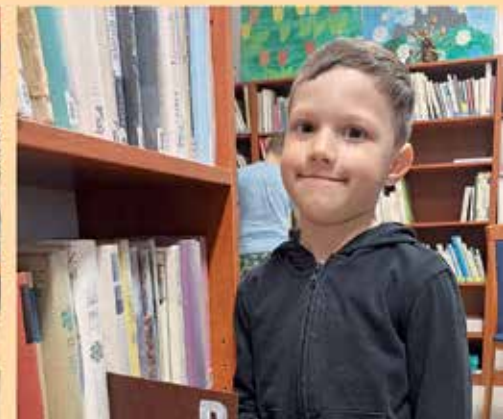
Dokumentace čtenářské dílničky v rabské knihovně.