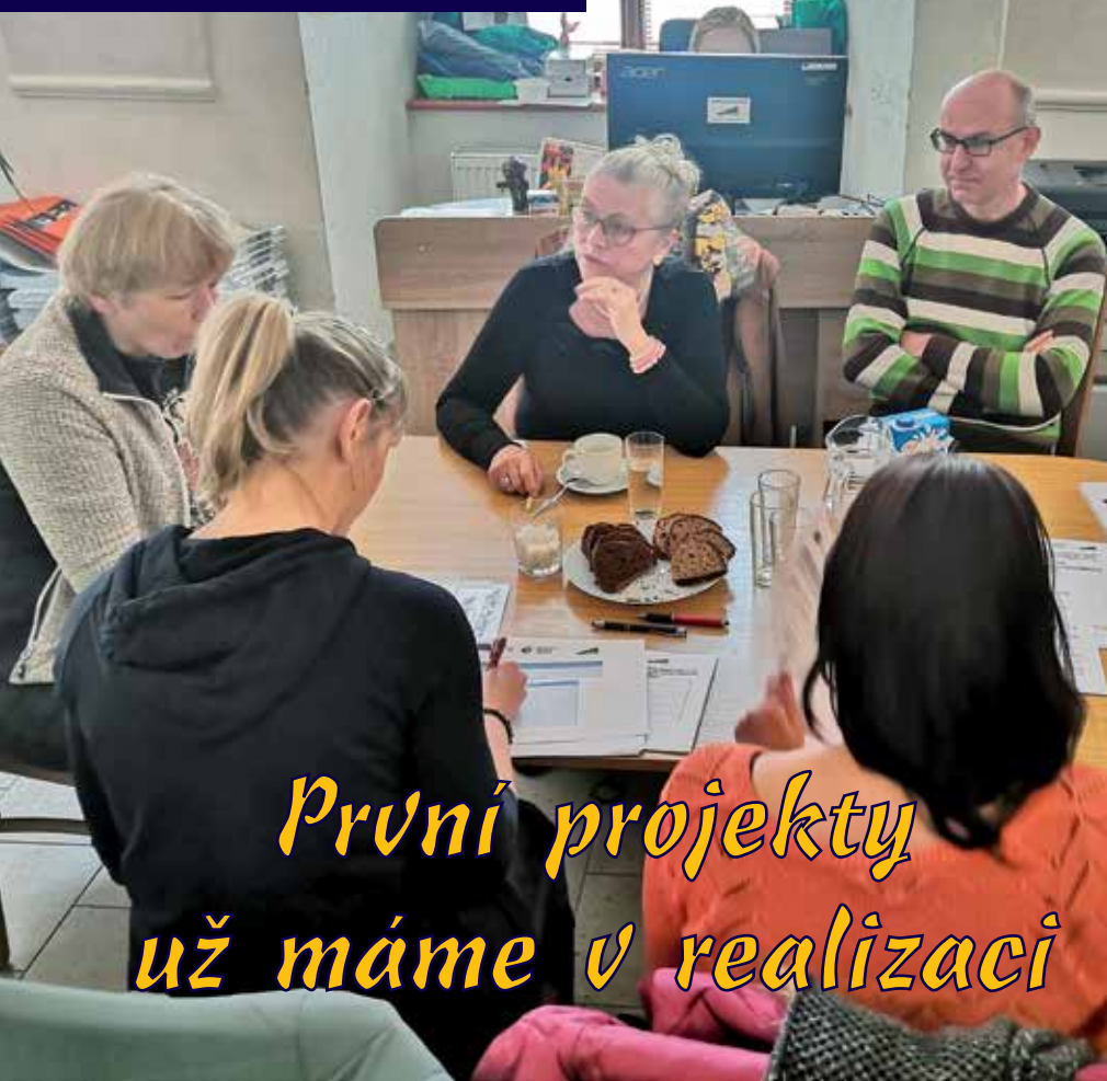
Jednání výběrové komise IROP 24. 4. 2024.

MAS Pošumaví vyhlásila v roce 2023 tři výzvy v oblastech zaměřených na podporu základních a mateřských škol a podporu jednotek požární ochrany kategorií II, III a V.