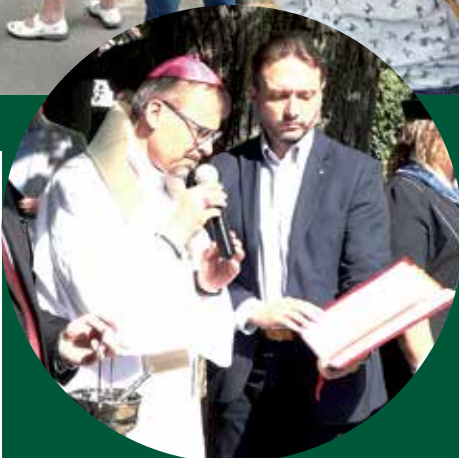
Plzeňský biskup v Kaničkách.

V centru obce stojí kaple Panny Marie, která byla postavena v r. 1862, kdy Kaničky spadaly do panství Černínů z Chudenic. Architekturu průčelí připomíná sýpku v nedalekých Únějovicích. Nikdy se nejednalo o památkově chráněnou stavbu, a tak léta chátrala. V roce 2016 byla z prostředků programu PSOV Plzeňského kraje provedena venkovní oprava fasády kaple, střechy a věžičky. Na opravu interiéru však neměla malá obec kvůli svým omezeným