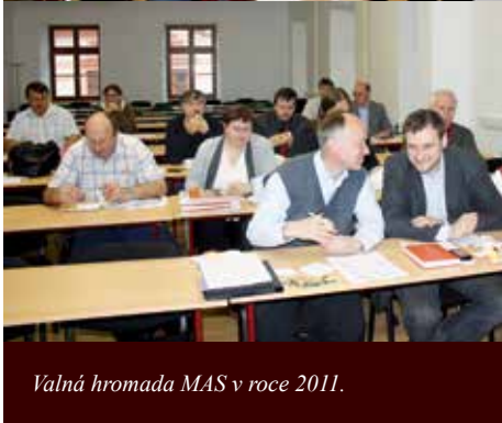
Valná hromada MAS v roce 2011.

MAS Pošumaví se díky zkušenostem se spoluprací různých aktérů rozvoje území Šance pro jihozápad zařadila od svého počátku k nejaktivnějším „maskám“ nejen v Plzeňském kraji, ale i v celé České republice. Již v prvních letech svého fungování byly na území MAS Pošumaví úspěšně realizovány různé projekty. Činnost organizace se zaměřovala i na výměnu zkušeností a spolupráci s dalšími MAS nejen z České republiky, ale také s podobnými „maskami“ z Evropské unie, kde měl program LEADER již dlouhou tradici. Nejužší kontakty byly navázány s LAG Regen ze sousedního Bavorska, ale také s obdobnými organizacemi z Irska a Francie.