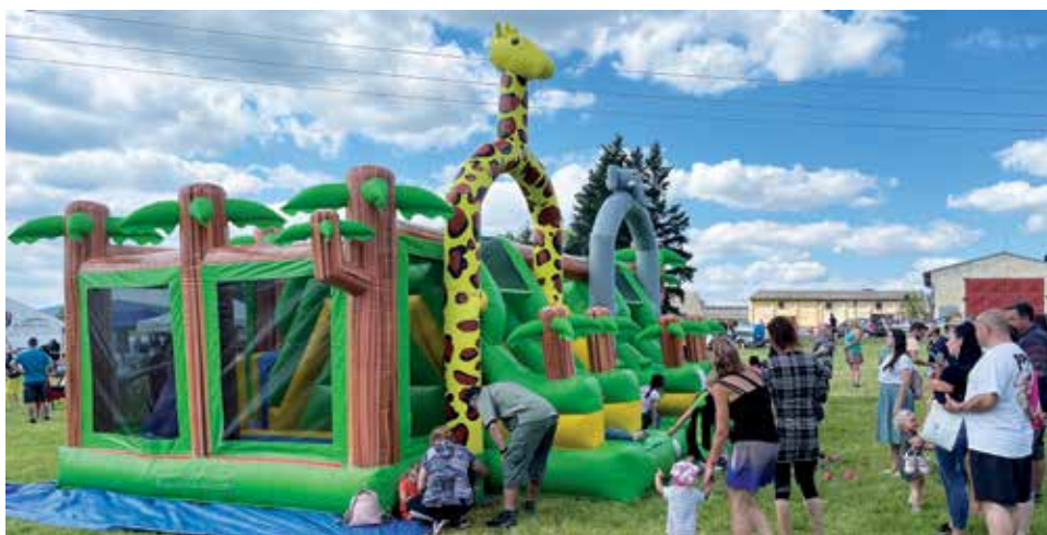
Atrakce zájmového sdružení právníků osob Plánicko na akci v Bolešínách.