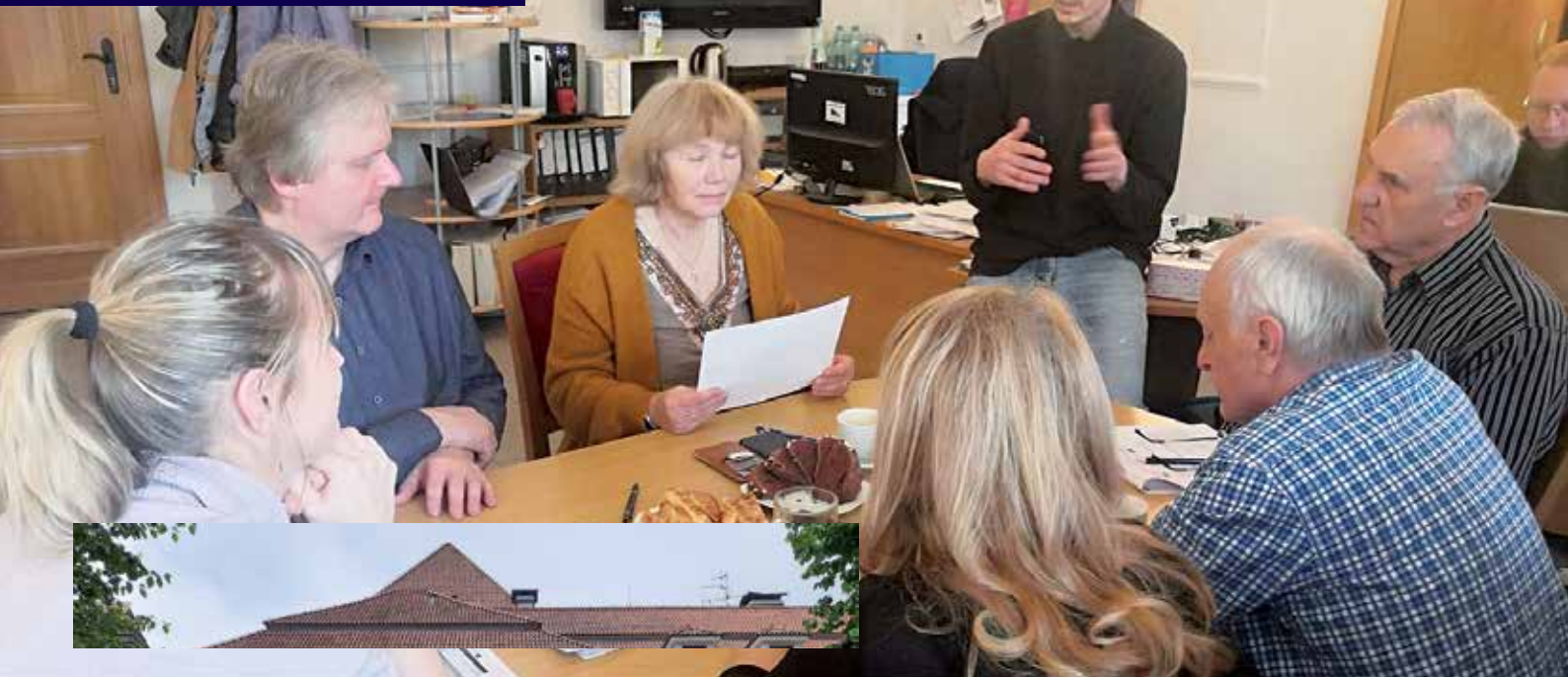
Jednání výběrové komise OPTAK 30. 1. 2024.