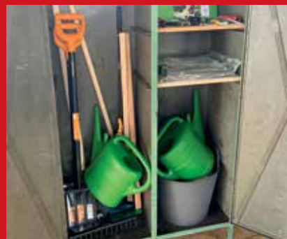
Komunitní zahrada – zahradní nářadí zakoupené z projektu OPZ+.