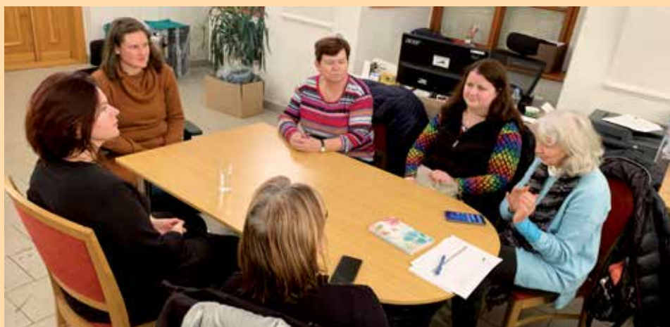
Lednové plánování komunitní zahrady v srdci Klatov.