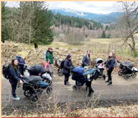
Aktivní maminky z Klatovska na předjarním výletě na Šumavu.

V Rabí již dlouho funguje spolek ROSa a SDH, jejichž členové připravují pro děti vlastní, již tradiční aktivity – tyto