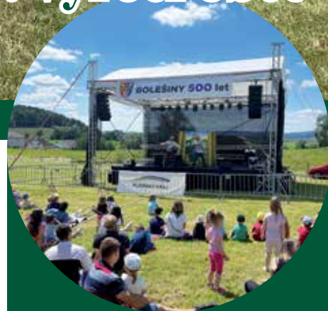
Pohádkové představení pro děti.