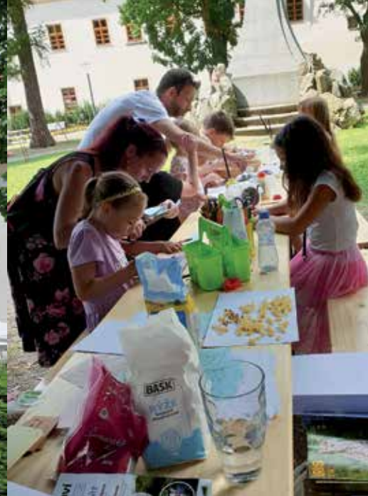
Nafukovací „džungle“ zájmového sdružení právnických osob Plánicko a aktivity na dni otevřených dveří MAS Pošumaví 27. června.