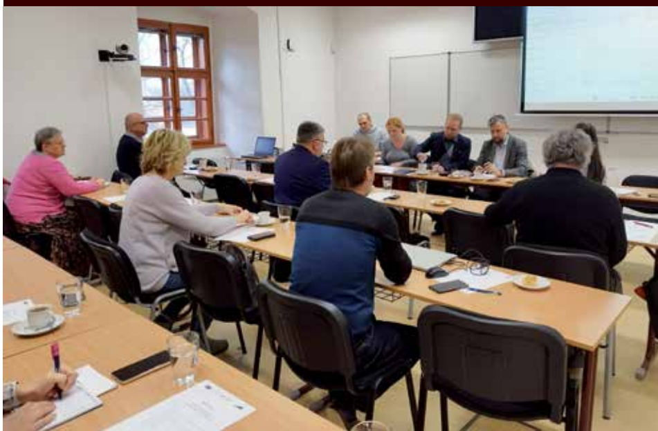
Členové výkonné rady a dozorčí rady při jednání v Klatovech.