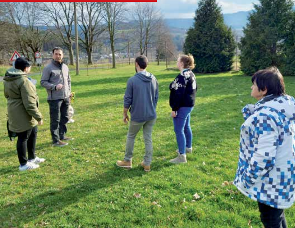
Jarní plánování výstavby dětského hřiště ve Strašíně.