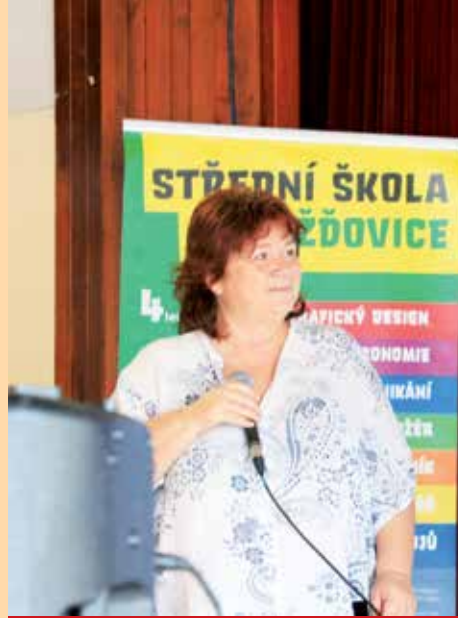
Dny dobrovolnictví jsme slavili s ředitelkou Mezigeneračního a dobrovolnického centra TOTEM Plzeň, kolegyně z MAS Pošumaví a práce komunity ve Velkých Hydčicích v dubnu 2024.

Aktivní maminky s dětmi z Klatovska se scházely velmi často (několikrát do měsíce), ať už se jednalo o společné cvičení, semináře znakování nebo výlety do Pošumaví a na Šumavu. Právě tato