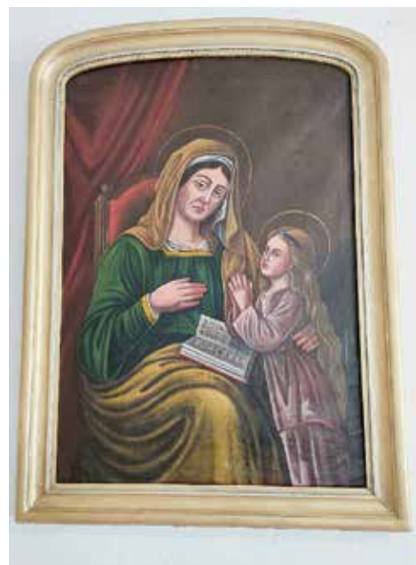
Obraz sv. Anny v interiéru kaple.

Obec Kaničky s počtem 32 občanů je nejmenší obec na území MAS Pošumaví a jednou z nejmenších v České republice. První písemná zmínka o maličké a půvabné obci Kaničky pochází z r. 1379.