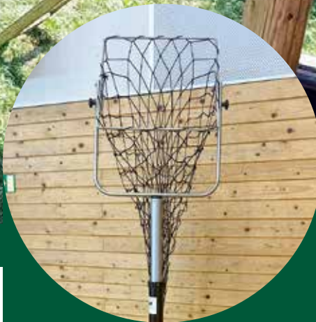
SK Volejbal Klatovy koupil nový trenažer.

Grantový dotační program MAS Pošumaví z finanční dotace Plzeňského kraje na rok 2023 jsme vyhlásili 12. května. Program je určený k podpoře spolků a neziskových organizací v našem území. Ty měly možnost žádat o vybavení k činnosti nebo finanční prostředky použít na pořádání kulturních akcí.