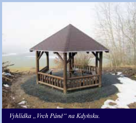
Výhlídka „Vrch Páně“ na Kdyně.

Celkové náklady projektu: 11 981 081 Kč Dotace: 11 382 026 Kč