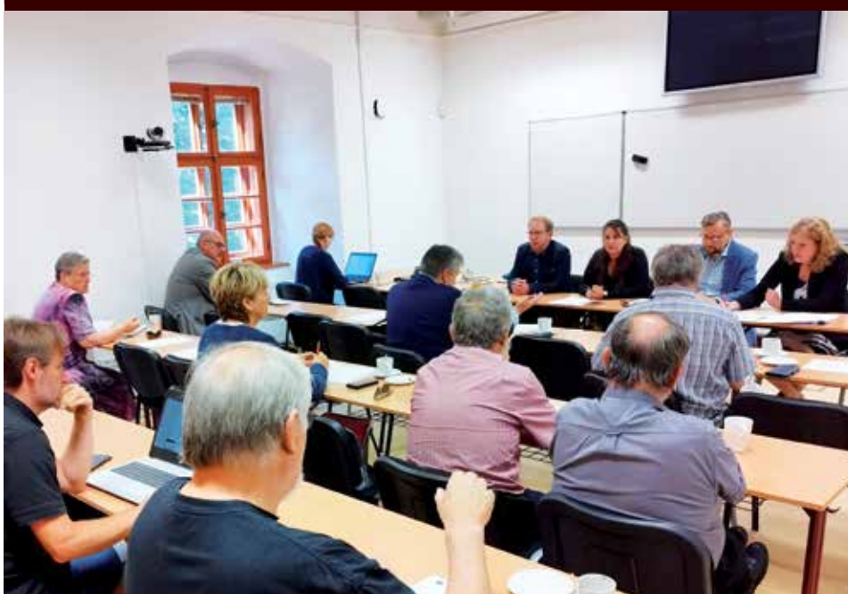
Členové výkonné rady a dozorčí rady při jednání v Klatovech.