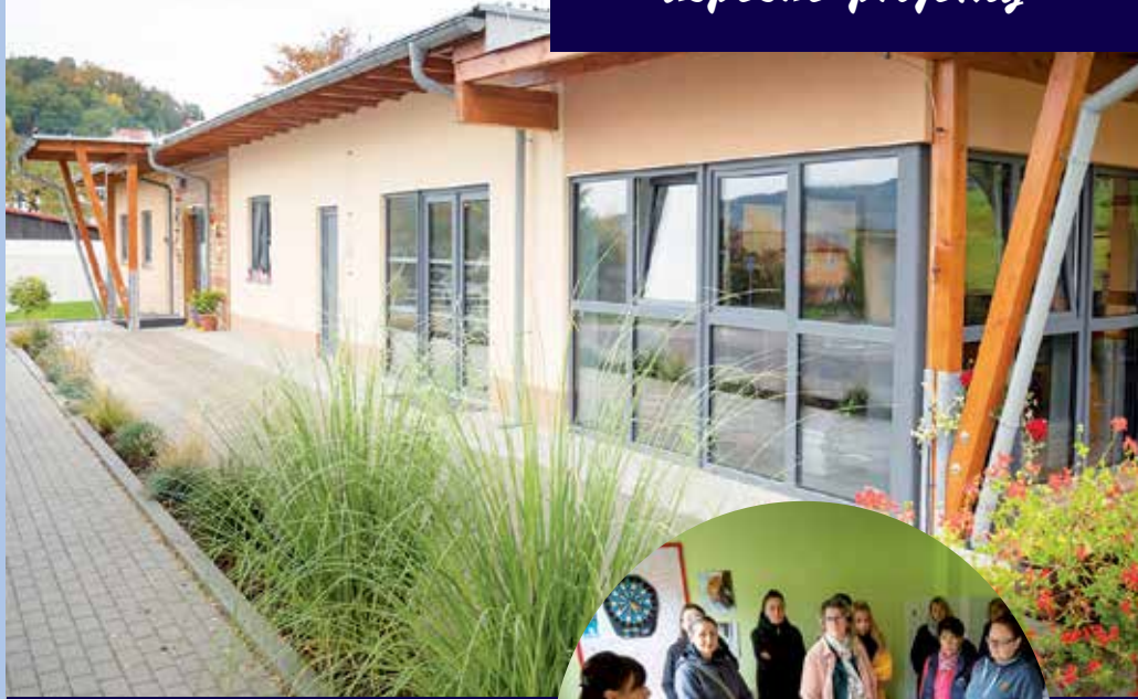
Budova denního stacionáře Klíček.

Budova nyní umožňuje rozdělit současné poskytované služby na dvě zóny. Na zónu klidnější v nové větší budově a zónu pracovní rehabilitace v původní menší budově. Samotná novostavba je také rozdělena na dvě části. V jedné se nachází dvě relaxační místnosti, bezbariérová koupelna s toaletou a místnost vybavená cvičebními pomůckami a motomedem (přístroj pro kruhový pohyb končetin podporovaný motorovým pohonem). Ve druhé části je k dispozici větší společenská místnost s kuchyňským koutem pro nácik vaření a místo pro společné stravování. Nechybí ani místa pro klidnější pracovní rehabilitaci,