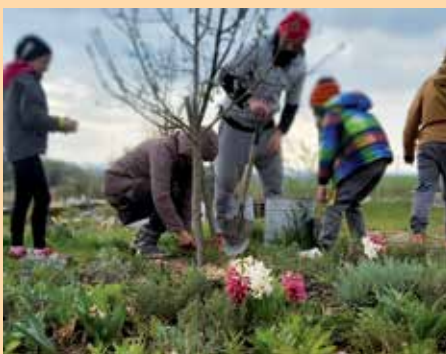
V komunitní zahradě Naše zahrádka se schází velké množství lidí a pořádají zde i hodně společných akcí.

Komunitní zahrady mohou pořádat nejrůznější společenské akce a události od grilovacích večerů přes hudební koncerty, divadla a workshopy pro veřejnost a tím přispívají k oživení města. Napomáhají tak k pozitivním sociálním jevům, jako je soudržnost obyvatel, integrace, rozvoj mezilidských a mezigeneračních vztahů.