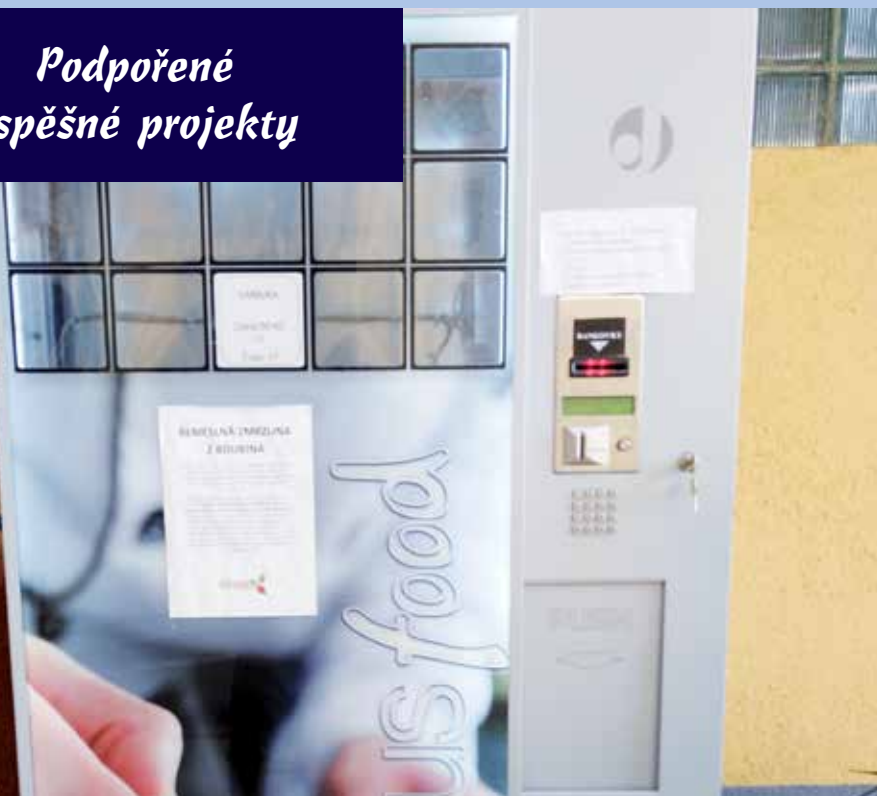
Automat na mražené výrobky pana Václava Duba.