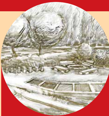
Záměr komunitního ohniště ve Velharticích.

Poté byl občanům představen samotný projekt včetně možností výsadby stromů.