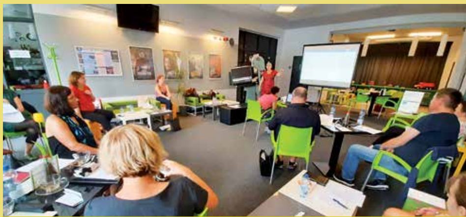
Setkání výchovných poradců v kinokavárně Sušice.

Projekty jsou zaměřeny na rozvoj vzdělávání v mateřských a základních školách. V jeho rámci zajišťujeme především školám celou řadu služeb. Od komplexního plánování rozvoje vzdělávání v celém území přes evidenci investičních záměrů a poradenství, semináře pro pedagogy i pro děti, dětské exkurze a zajištění logopedické péče, až po půjčovnu specializovaných pomůcek. Projekt si za ta léta získal na straně škol přízeň, a to především díky nabídce vzdělávacích aktivit pro učitele a pro děti, které