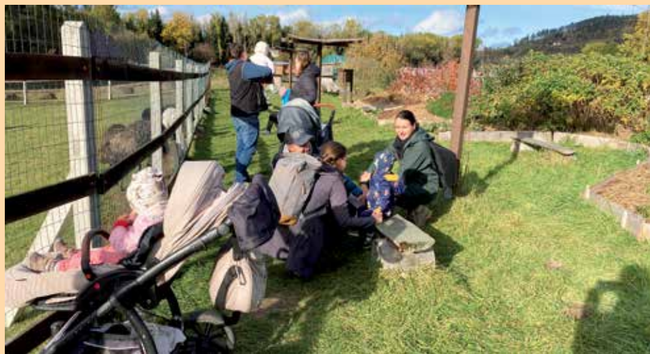
Aktivita rodičů s dětmi.

Od července proběhla již řada setkání, na kterých jsme mapovali naše potřeby,