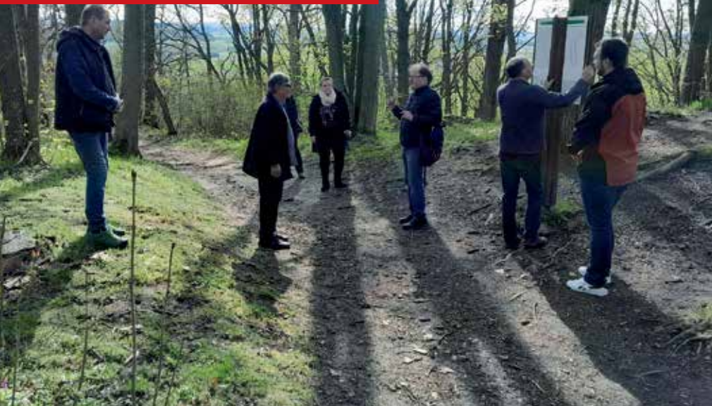
Setkání dobrovolníků na Práchni.

mentovanou procházku po Práchni. Té se zúčastnilo přes 60 lidí.