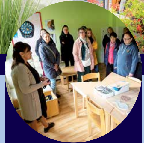
Na návštěvě ve stacionáři.