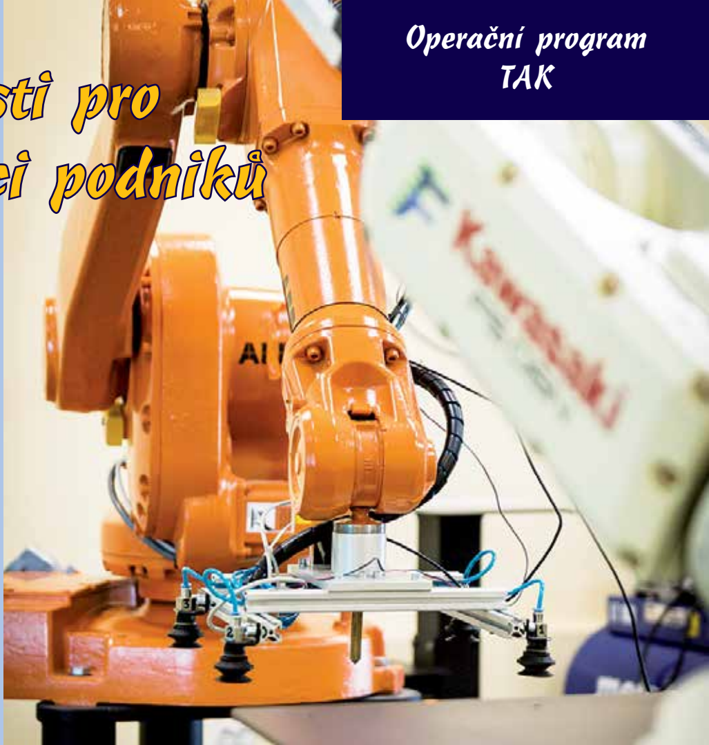
Robotická ruka jako příklad inovace ve výrobě.

dajů. Termín ukončení příjmu projektových záměrů je stanoven na 31. 12. 2023 a nejzazší termín ukončení realizace projektu je 30. 6. 2026.