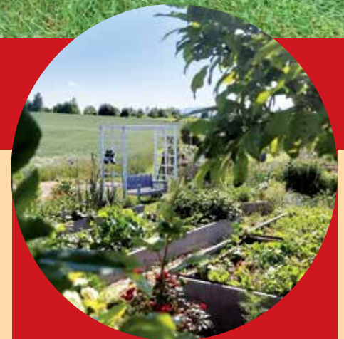
Komunitní zahrada „Naše zahrádka“ v Rudolfově.