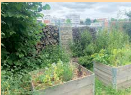
Zahrada „U Řeky“, Brno - výuková zahrada především pro děti.

Podle výzkumů a studií jednotlivých komunitních zahrad zjišťujeme, že tento fenomén přináší několik výhod nejen na individuální úrovni, ale především na úrovni sociálních vztahů jako takových. Většina odborných studií zdůrazňuje, že přínos komunitních zahrad je převážně v oblasti zdravé výživy, zvýšení fyzické aktivity, a naopak snížení stresových situací. Zahradníci mají obecně větší spotřebu čerstvé zeleniny ve srovnání s lidmi,